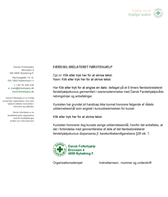
Billede 7 Den blanket, instruktøren kan give den handicappede

En kursist kan muligvis ikke gennemføre kurset på grund af et handicap. I sådanne tilfælde er der etableret en procedure, hvor instruktøren kan udfylde et skema, der dokumenterer, hvilke kompetencemål personen ikke opfylder. Personen kan derefter indsende dette skema til politiets administrative center, som vil give mulighed for at erhverve et kørekort uden at skulle gennemføre det almindelige førstehjælpskursus.