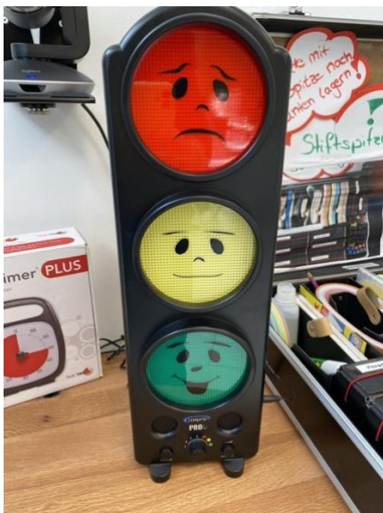
Slika 4 "Semafor raspoloženja" - alat koji pomaže djeci, koja inače imaju poteškoća u tome, da prenesu svoje trenutne osjećaje.

koji je potreban kako bi se zadovoljile potrebe svakog učenika.