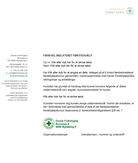
Slika 7 Obrazac koji instruktor može dati osobi s invaliditetom

Ova dva sustava omogućuju izdavanje potvrda o prvoj pomoći osobama s invaliditetom koje su im nedostupne čak i kada su im dijelovi tečaja ili određeni dijelovi nastave koji se predaju. Osim certifikacije kao takve, to omogućuje osobama s invaliditetom da sudjeluju ravnopravno s ostalim sudionicima tečaja.