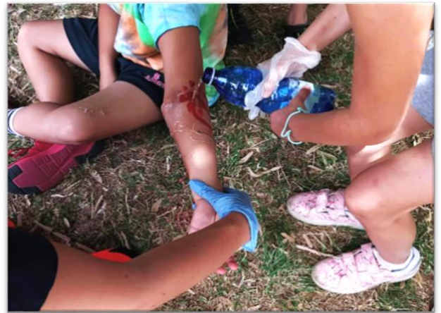
Slika 2 Igra uloga u akciji!

ANPAS praksa: "Inkluzivna obuka prve pomoći: učenje iz iskustva" – Croce Azzurra di Paviglio