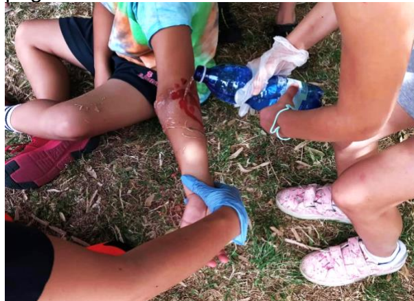
Vaizdas 2 Vaidmenų žaidimas!

FORMABILI ir pereinant prie praktinės patirties mokant neįgaliuosius pirmosios pagalbos.