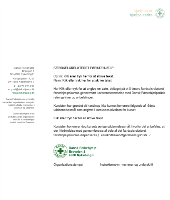
Attēlā Nr. 7 Veidlapa, ko instruktors var dot personai ar invaliditāti

Šīs divas sistēmas ļauj izsniegt pirmās palīdzības sertifikātus cilvēkiem ar invaliditāti, kas pat tad, ja kursa daļas vai konkrētas mācītā priekšmeta daļas viņiem nav izpildāmas. Papildus sertifikācijai kā tādai, tas ļauj cilvēkiem ar invaliditāti piedalīties ar tādiem pašiem nosacījumiem kā citiem kursu dalībniekiem.