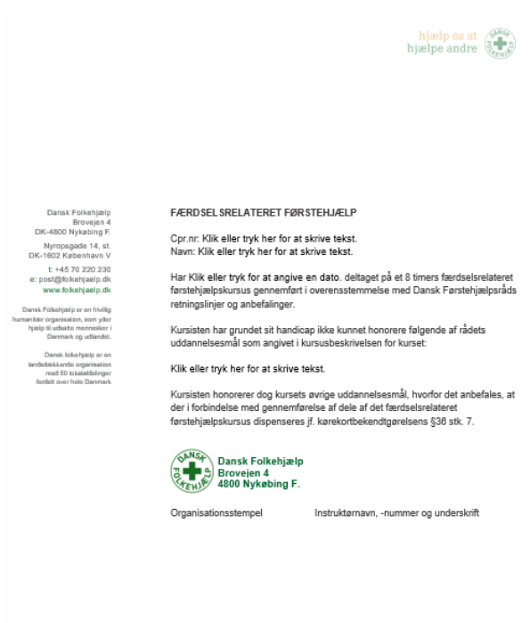
Слика 7. Формата која инструкторот може да му ја даде на лицето со попреченост

Овие два системи овозможуваат да се издадат сертификати за прва помош на лицата со попреченост, дури и кога делови од курсот или одредени делови од предметот се недостапни за нив. Освен сертификацијата како таква, ова им овозможува на лицата со попреченост да учествуваат на еднаква основа со другите учесници на курсот.