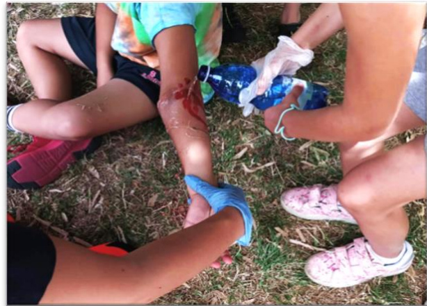
Слика 2 Играње на улоги во акција!

Организациите на ANPAS и нивните волонтери инвестираа во темата за инклузивно спасување и прва помош во изминатите неколку години и многу релевантна работа е направена во оваа област - почнувајќи со гореспоменатиот проект FORMABILI и напредувајќи кон практично искуство во учењето на лицата со попреченост за прва помош.