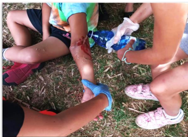
Slika 2 Igra uloga u akciji!

Organizacije ANPAS-a i njihovi volonteri poslednjih nekoliko godina posvećeni su temi inkluzivnog spašavanja i prve pomoći, pri čemu je u ovom polju sprovedeno mnogo relevantnog rada – počevši od već pomenutog projekta FORMABILI i nastavljajući sa praktičnim iskustvom u obrazovanju osoba sa invaliditetom za pružanje prve pomoći.