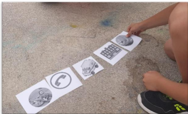
Slika 1 Vizuelna pomagala. Nakon pozitivnih rezultata ovog jednostavnog iskustva, predavači predlažu da se u budućnosti uvedu obuke prve pomoći koje koriste piktograme za augmentativnu i alternativnu komunikaciju.

Iako ANPAS čine mnoge organizacije sa opsežnim iskustvom i velikim brojem volontera, i iako su mnoge situacije zahtevale da volonteri budu obučeni za spašavanje osoba sa invaliditetom, širi ANPAS pokret još uvek ne pruža redovno specijalizovane kurseve, priručnike niti instrumente dizajnirane na nacionalnom nivou za podučavanje prve pomoći osobama sa invaliditetom..