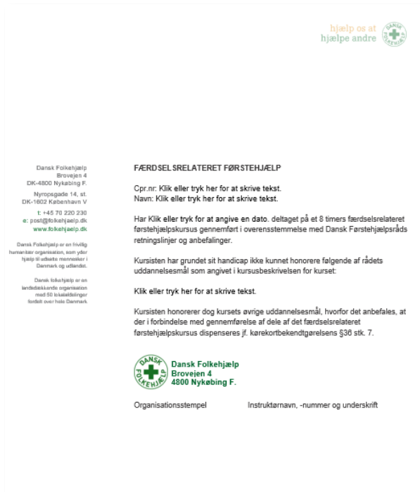
Slika 7 Obrazac koji instruktor može dati osobi sa invaliditetom

Ova dva sistema omogućavaju izdavanje sertifikata iz oblasti prve pomoći osobama sa invaliditetom, čak i u situacijama kada su pojedini segmenti obuke ili određeni delovi nastavnog sadržaja njima nepristupačni. Pored omogućavanja izdavanja sertifikata, ovakav pristup osigurava ravnopravno učešće osoba sa invaliditetom sa ostalim polaznicima obuke, čime se unapređuje inkluzivnost i jednakost u procesu obrazovanja.